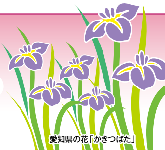
愛知県の花「かきつばた」

発行所：(公社)愛知県防犯協会連合会 名古屋市昭和区円上町26番15号 愛知県高辻センター 2階 (052)871-2110