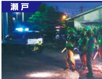
長根連区連合自治会青パト隊

隊員は90名です。「自分たちの街は自分達で守ろう」を基本理念に、夜間パトロールを始め、児童の登下校時の見守り活動や学校行事、学区の祭りやイベントの警備等、犯罪抑止に積極的に取り組んでいます。