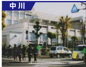
中川区五反田学区防犯パトロール隊

区政協力委員、老人会、女性会、PTA等総員78名です。月～金曜日までの毎日2回の巡回パトロールを行い、夏休み・年末には学区民と警察の合同パトロールを実施しています。