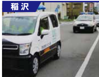
西光坊防犯パトロール隊

隊員176名です。小学生児童の下校時の見守りや、夜間の巡回パトロールをしています。6月1日に、警察署長や小学校長の出席の下、隊員等120名が参加して結成式を行いました。