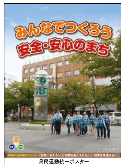
県民運動統一ポスター

「 平成30年度安全なまちづくり愛知県民大会 」を開催します。“わが町・わが地域の安全・安心”をめざし、警察や自治体、地域ボランティアの方々と連携して、多彩な地域安全活動を展開します。皆さんも、地域での活動にご理解とご協力をいただき、家族で「地域安全」・「家庭の安全」についてよく話し合っ、この運動に積極的に参加をお願い致します。