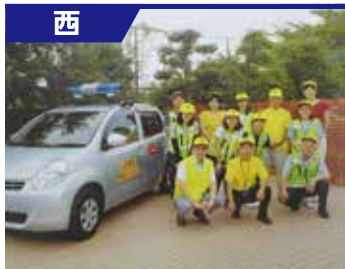
山田学区防犯パトロール隊

その活動は、地域住民の安心感と連帯意識を強化し、不審者を寄せつけなくすることで地域防犯力の要としての役割を担っています。