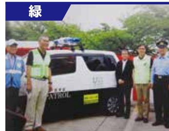
戸笠学区連絡協議会防犯パトロール隊

隊員は18名です。小中学校生徒の登下校時の青パト巡回を始め、ゼロの日や夜間の全各町内会パトロールにも参加したり、防犯灯の点検も行い、明るく住みやすい街づくりを目指しています。